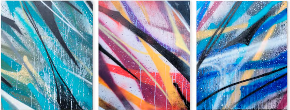
Format x 3 : 55 x 46 cm Aérosol et Projection d'acrylique sur toile. Oeuvres originales réalisées en 2024.

Ces œuvres s'inscrivent dans un travail mural plus vaste et résultent de toiles accrochées directement au mur, comme si j'avais emporté une partie d'un espace qui demeure habituellement sur place, fruit d'une création et à la merci de l'effacement.