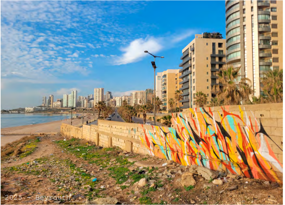
2025 - Beyrouth