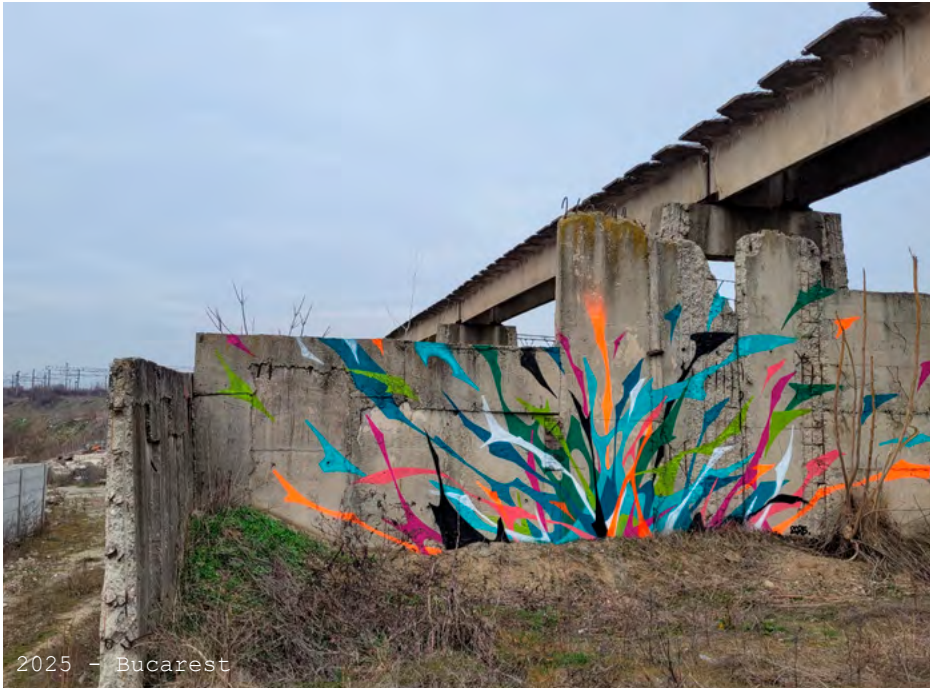
2025 - Bucarest