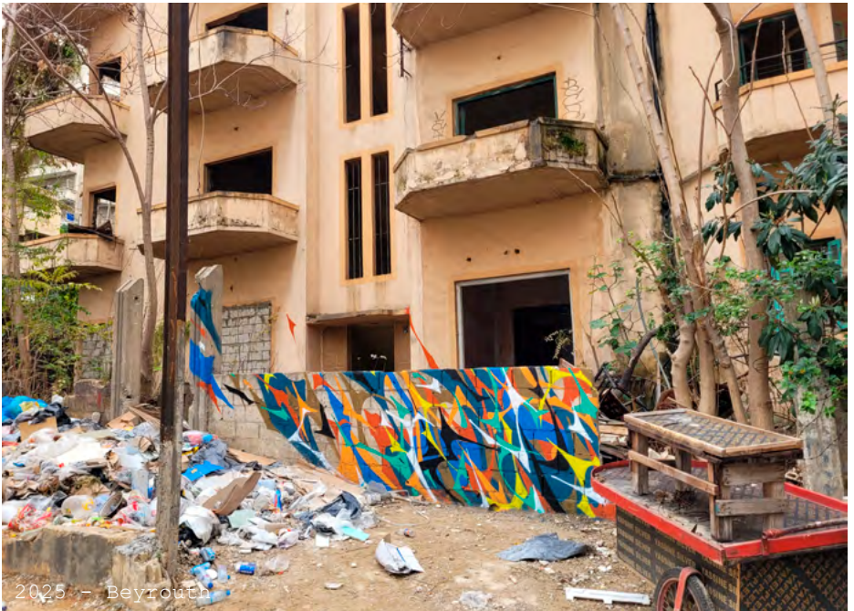
2025 - Beyrouth