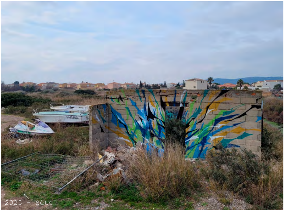
2025 - Sète